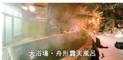
大浴場・舟形露天風呂